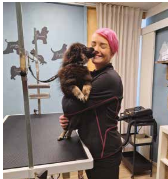
KUVAT: KARVAKORVIEN ALBUMI

Käytössään Karvakorvilla on 400 m 2 :n myymälätila, jossa on laaja valikoima erikoisliikkeen tuotteita koirille, kissoille ja pieneläimille sekä perusvalikoima akvaarioharrastajien tarpeisiin. ●