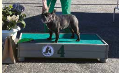
4. RANSKANBULLDOGGI CARTE TRUFFÉ TRUE LOVE, om. Lindroos Outi