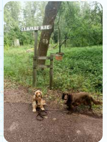
AHVENANMAA ON JUMALAISEN VEHRÄÄ JA LEHTEVÄ, SIISI PIENI PARATIISI PUNAISINE MAANTEINEEN, SOMINE KYLINEEN, ERINOMAISEN HYVINHOIDETTUINE MAATILOINEEN JA KUKKOISTAVINE HEDELMÄTARHOINEEN.