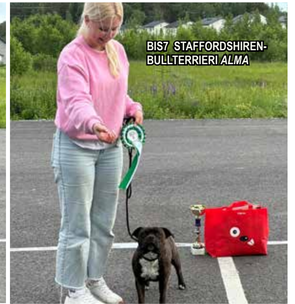
BIS7 STAFFORDSHIREN- BULLTERRIERI ALMA