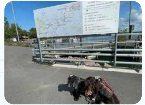
KUSTAVI. SEIKKAILU ALKAKOON...