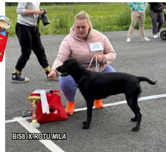
BIS8 X:ROTU MILA