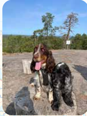
GETABERGEN. AHVENANMAAN KATOLLA.