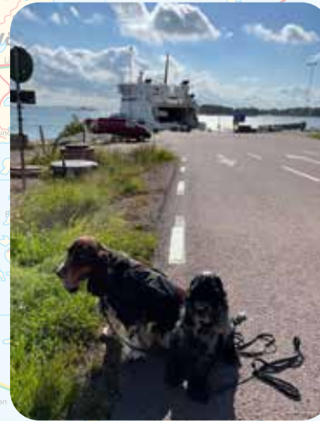
HUMMELVIK, VÄRDÖ. POJAT LÄHDÖSSÄ YHTEYSALUKSELLE KOHTI BRÄNDÖÄ