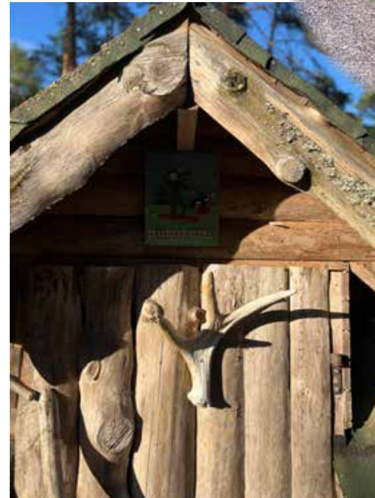
VEHMAAN ERÄVEIKKOJEN TUKIKOHTA