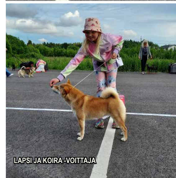
LAPSI JA KOIRA -VOITTAJA