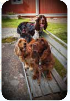
KUSTAVIN KIRKOLLA, PÄ EGTNLIGA FINLANDS SIDA