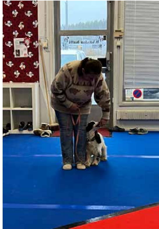
DEMOKOIRA CESSI ESITTÄÄ SEURAAMISEN VAIHEITA.