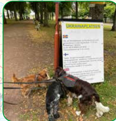
SLAVA UKRAINI! JOKA PV KLO 17 MIELENOSOITUS VENÄJÄN KONSUULATIN EDESSÄ. SPANIELIKOPLA JÄRJESTI OMAN MIELENILMAUKSENSA.