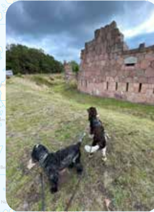
BOMARSUND. FRANSMANNIT JA ENGELSMANNIT RÄJÄYTTIVÄT VENÄLAISTEN LINNOITUKSEN ITÄMAISESSA SODASSA 1850-LUVULLA.