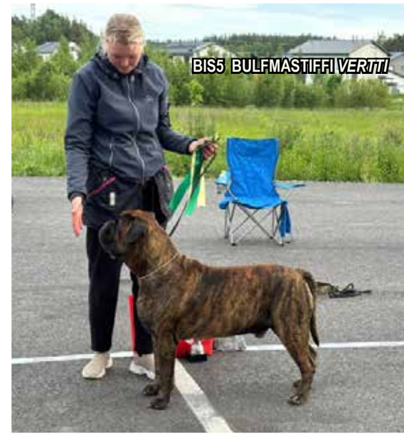
BIS5 BULFMASITIFFI VERTTI