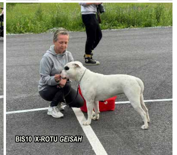
BIS10 X:ROTU GEISAH