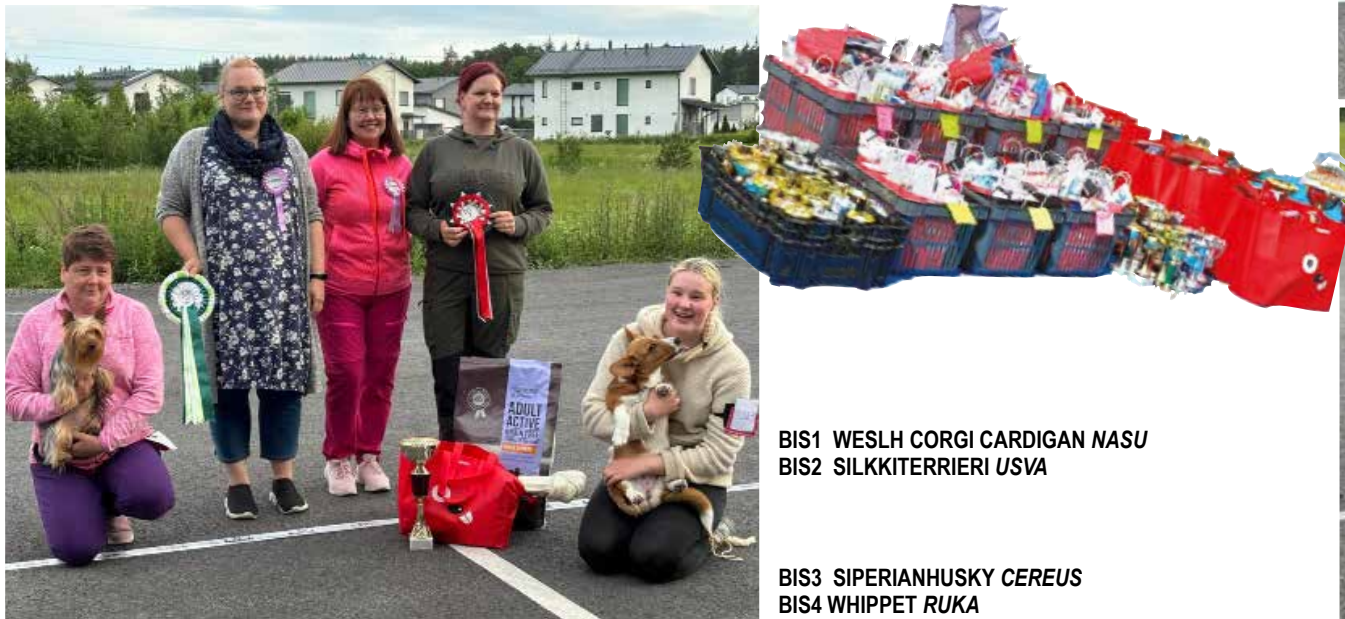
BIS1 WESLH CORGI CARDIGAN NASU BIS2 SILKKITERRIERI USVA BIS3 SIPERIANHUSKY CEREUS BIS4 WHIPPET RUKA

Toimikunta haluaa kiittää Dogmania loistavista palkinnoista. Kiitos myös asiantunneville tuomareille sekä kaikille osallistujille!