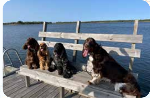
BASTÖN RANNASSA, FINSTRÖM

Arenan, Hunnin, Pianon ja Viljon kesäretki vei elokuussa tutkimusmatkalle Ahvenanmaan lehteville kunnalle, kallioille ja kukkuloille, vilvoittaville vesille ja historian aarteille.