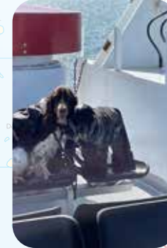
HOIJAA, ME NUORET MERIPOIJAAT...