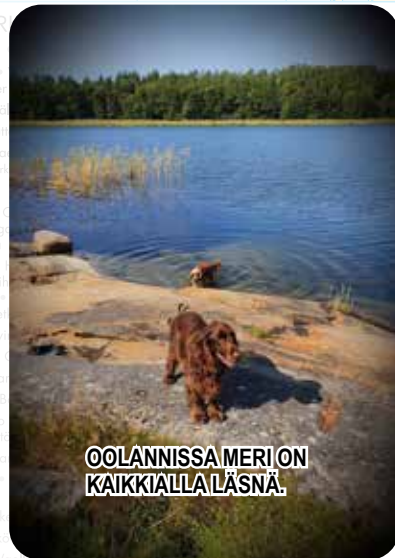
OOLANNISSA MERI ON KAIKKIALLA LÄSNÄ.